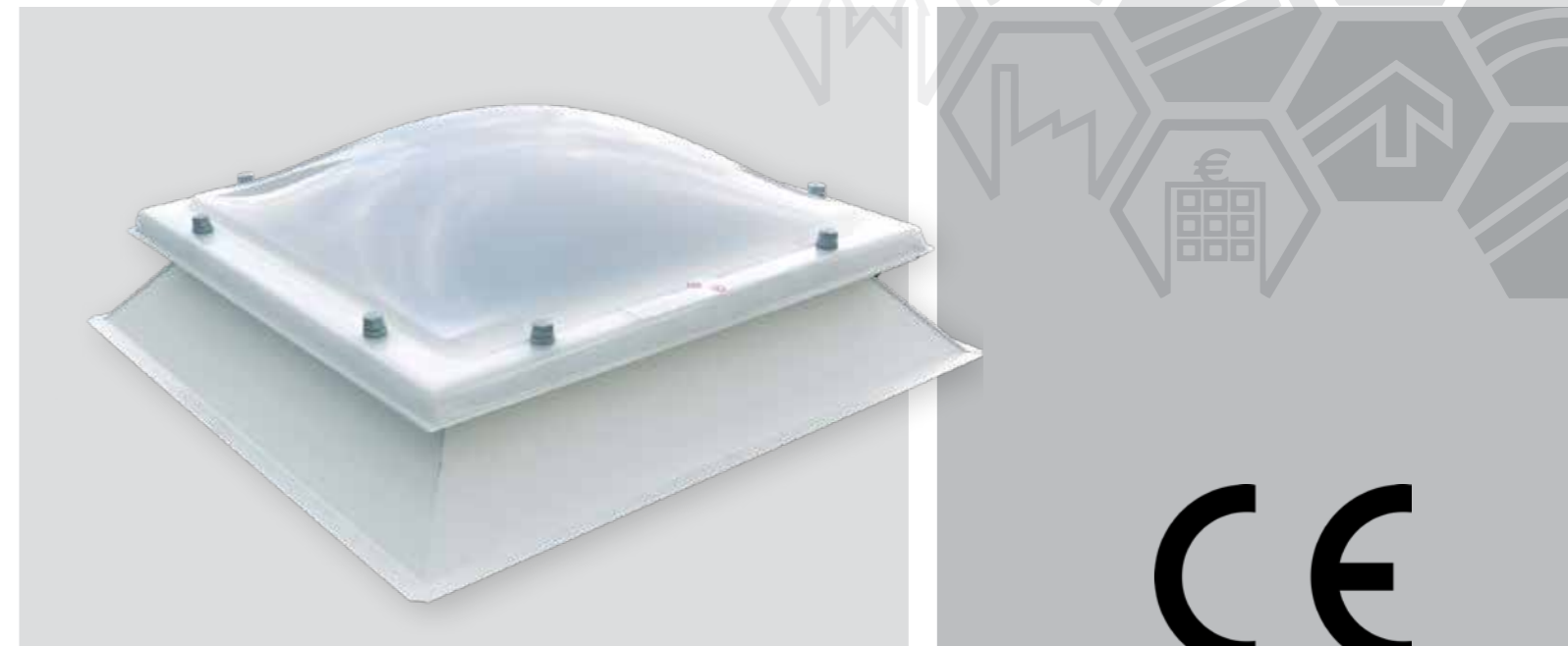
figuur 2 | CE keurmerk